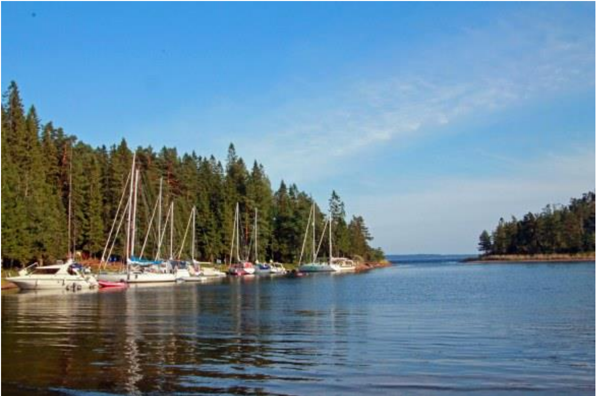
Norrfällsviken, Europas största (?) klapperstensfält. Fiskarfänget rest.!