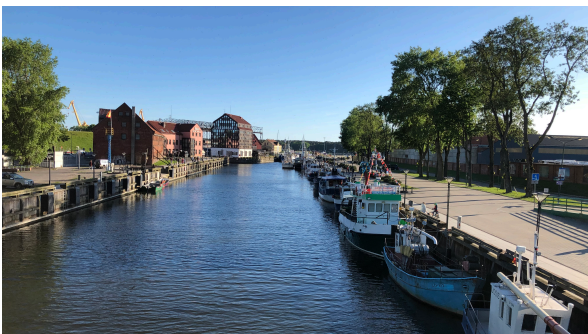
Kanalen mot Klaipeda's centrum

Klaipeda har en intressant historia då bl a svenskarna förstörde stan 1629. Den var även huvudstad i Preussen och hette då Memel. Idag bor ca 190 000 personer där. I Klaipeda besökte vi bl a Klaipeda Castle och gamla stan. Dom är definitivt värda ett besök. Det finns även gott om restauranger och barer.