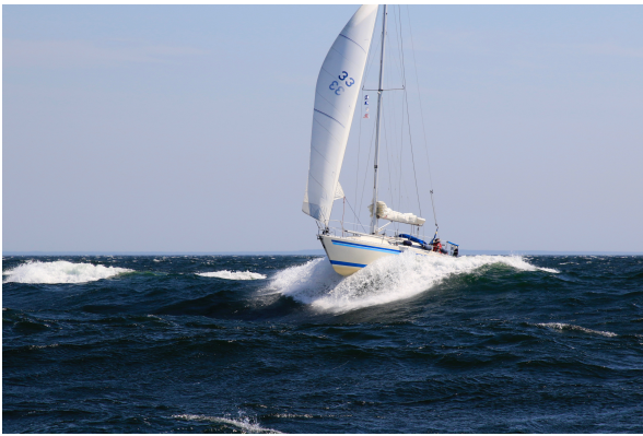
Gitsan i 11 knop på bara genuan