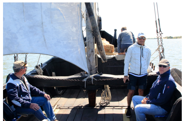
Tur med gammal segelskuta på Kuriska Sjön