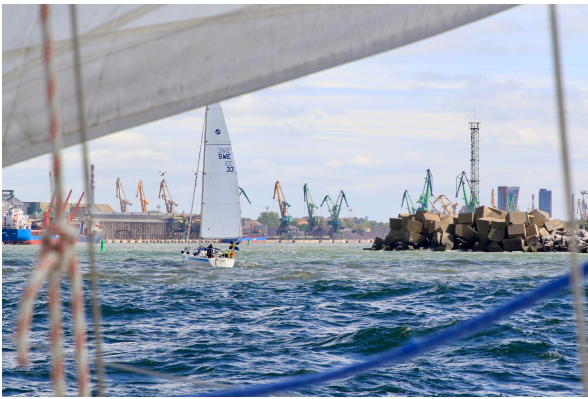
Inseglingen i Klaipeda's hamn

Infarten till Klaipeda var spännande med massor av fartyg utmed kanalen, betydligt större hamn än i Liepaja. Där finns två gästhamnar att välja på. En på stadssidan som heter Old Castle Harbour och en på Kuriska Näset mitt emot som heter Smiltyne Guest Harbour. Vi blev rekommenderade att välja Smiltyne p g a att det kunde vara fullt i den andra hamnen och att Smiltyne är nyare och fräschare. Det går regelbundet färja emellan så det är ganska lätt att ta sig över.