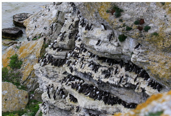
Fågelklipporna var imponerande

Lagom till turbåten närmade sig lämnade vi bryggan och drog norrut mot Landsort och Skravleviken.