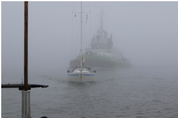
Spöklik avfärd från Klaipeda - hjälp - jagad!

Dagen för avfärd blev speciellt spännande då en tjock dimma belägrade staden och vattnet utanför. Vi höll oss nära ena kanten. Ibland kom tutande arbetsbåtar och större fartyg otäckt nära, dök upp ifrån ingenstans som spökskepp.