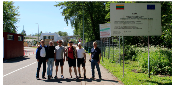
Vår guide blev väldigt nervös bara av att ta bilden vid gränsen mot Kaliningrad