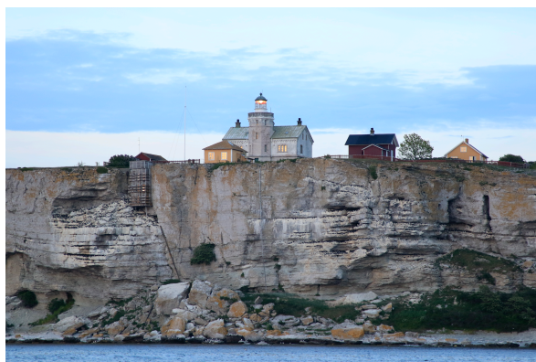
Rundade Stora Karlsö fyr och fågelklipporna på väg mot norra hamnen

Sedan fortsatte vi vår färd mot Stora Karlsö. Med endast en båt till vid bryggan fick vi plats. Tidigt nästa morgon tog vi en rundtur på ön och gick in i grottan Stora Förvar, besökte fyren och vandrade utmed fågelberget och runt Marmorberget tillbaka till hamnen. Muséet är också väl värt ett besök.