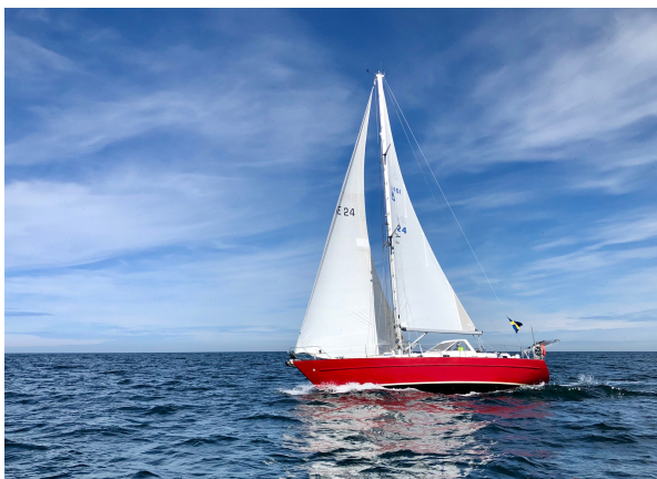
Rubina med god fart på hemväg

Väl ute på öppet vatten släppte så småningom dimman och vi kunde återigen njuta av en frisk halv vind upp mot Vändburg på södra Gotland. Vindarna låg stadigt på 8-13 m/s. Överfarten tog ca 24 timmar för ca 120 Nm.