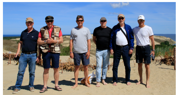
Hela eskadern på Nidas högsta sanddyn