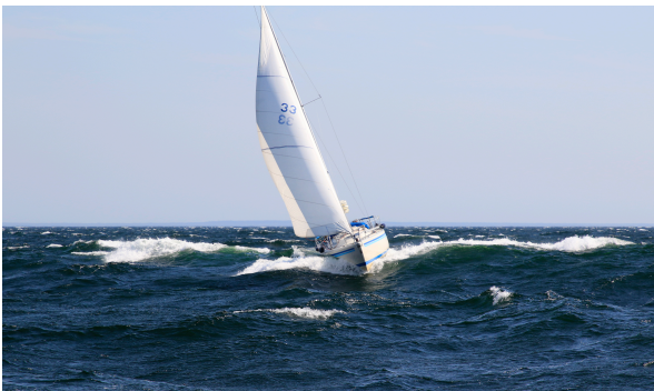
Forsar fram i fantastiskt väder