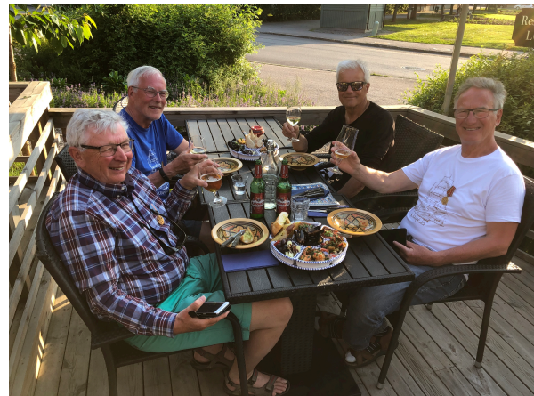
Firar på L'Oasis i Strängnäs efter 2 veckor på sjön och en lyckad eskadersegling

Färden till Västerås gick som på en dans med stopp i Skanssundet för medaljutdelning och Strängnäs för att fira att vi överlevde den här gången också med middag på restaurang L'Oasis.