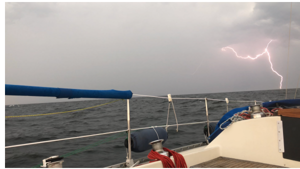
Lyckades fånga en blixtpå film

Lagom till skymningen kom ett par rejäla åskväder. Det första passerade precis framför oss, det andra strax bakom. Blixtar har jag stor respekt för så det var riktigt otrevligt. Skönt att Rubina har högre mast ;-)