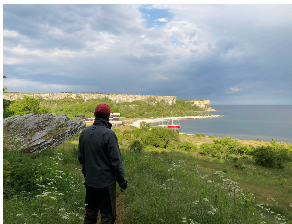
Utsikten från Stora Förvar