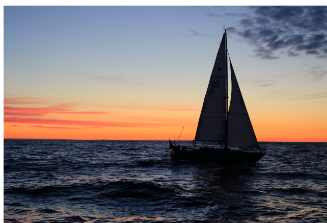
Gitsan strax efter solnedgång mitt ute på Östersjön

Spåret på Östersjön. Här syns dom kursmarginaler vi höll för ev. vindkantring.