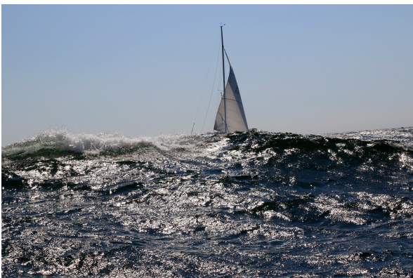
Gitsan leker kurragömma