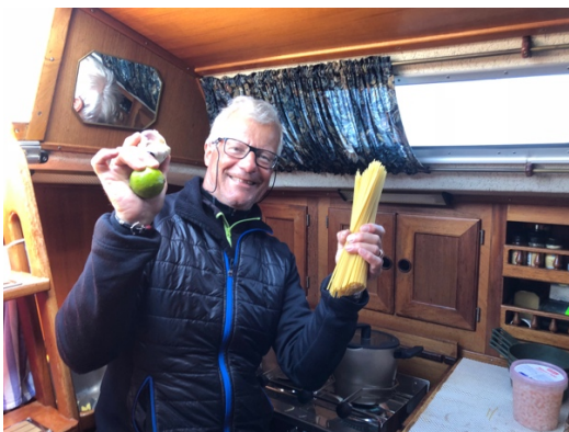
Skepparen på Gitsan lagar Thaiändsk pastarätt under färd