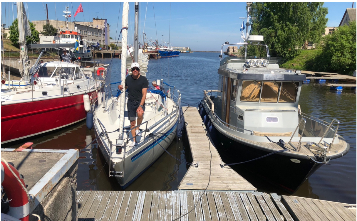
Gästhamnen i Roja