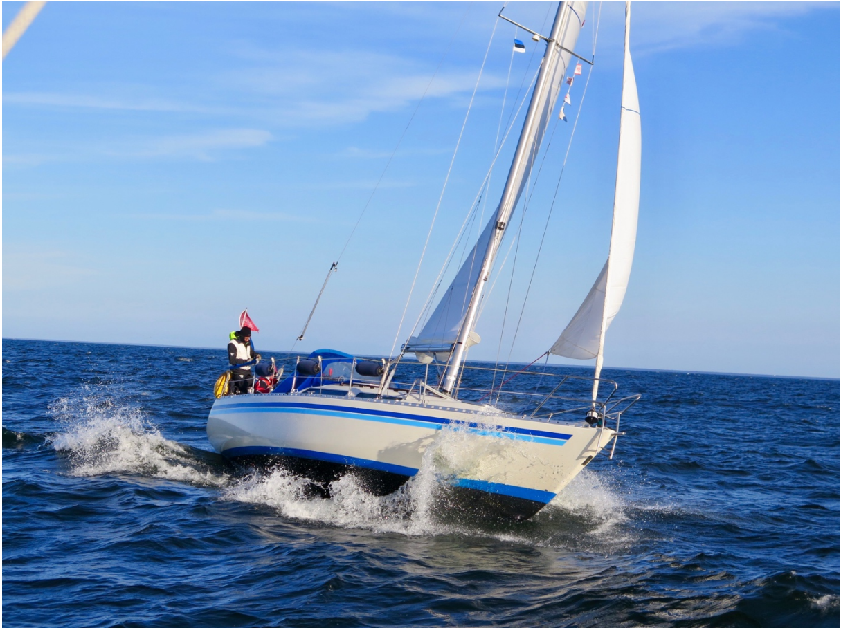
Med revad stor och inrullad fock i fina vindar mellan Lettland och Gotland