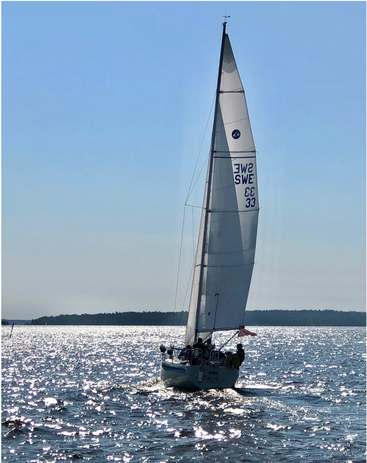
Gitsan med ny stor och fock över Mälarfjärd på väg mot Södertälje