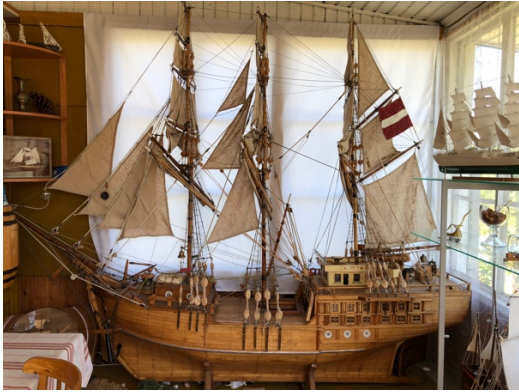
Besök på modellbåtsmuseum i Roja