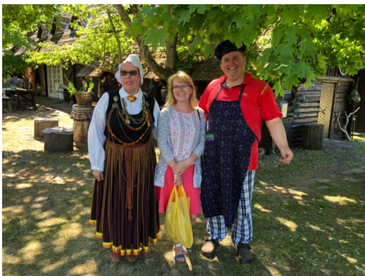
Besök på kulturgård för att uppleva hur svenskarna bodde och åt.