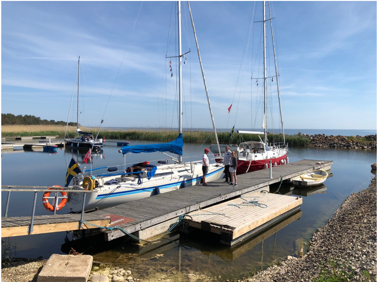
Gästhamnen på Runö