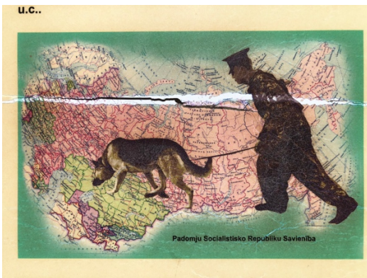
Rester av ryska tiden i Kurland