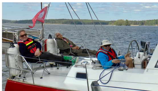
Rubinas besättning jobbar hårt för att ta sig förbi Oknö Udde.

Tre båtar avseglade från Västerås på morgonen tisdagen den 23 maj. Solen sken och svaga akterliga vindar tog oss med segel och motor till Rastaholm för gemensam middag med traditionsenliga ärtsoppa.