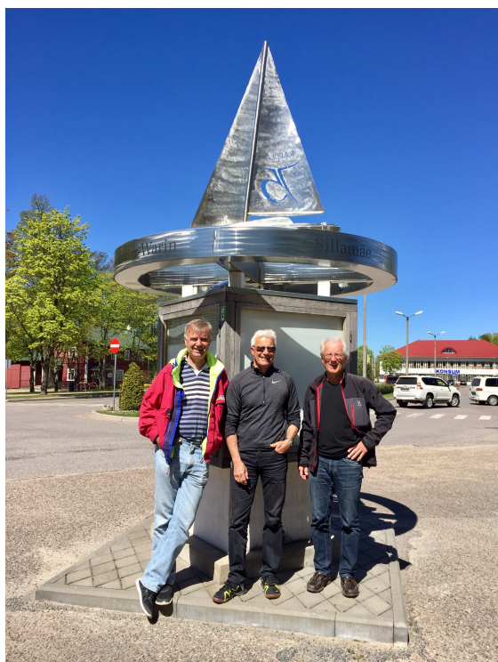
Gitsans besättning i Kärddla centrum.