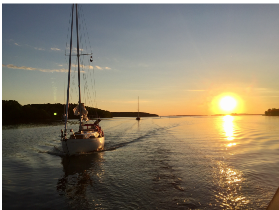
Vacker solnedgång in mot Stockholm. Det blev en vacker kväll in mot Stockholm och Reymersholme för en kort natthamn innan Liljeholmsbron öppnade kl. 04.

Vägen till Sandhamn gick via Baggensstället och Napoleonviken, som blivit en tradition för oss genom åren att besöka för gemensamma måltider.