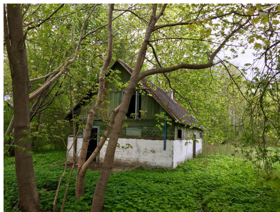
Övergivet hus i kanten av en av stadens många parker.

Staden är Dagös enda. Kärddal som den hette på svensktiden, omtalas för första gången 1564 och fick stadsrättigheter 1938. Där bor idag ca 3000 invånare. Här finns Konsum och svenska banker. Staden är pittoresk med mycket parker, gamla hus som många är i behov av renovering.