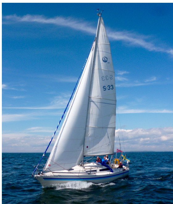
Gitsan med fock, gennaker på rulle beredd.