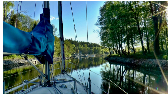
Baggensstället i soluppgång.

Vägen till Sandhamn gick via Baggensstället och Napoleonviken, som blivit en tradition för oss genom åren att besöka för gemensamma måltider.