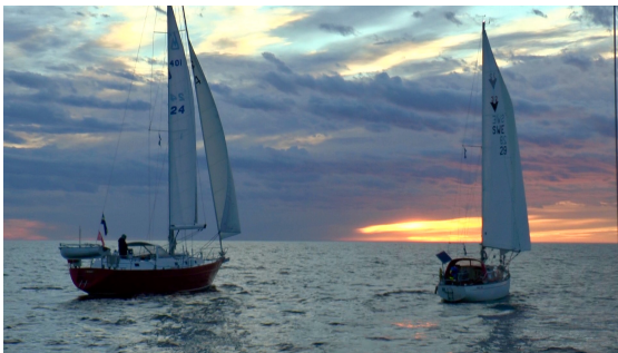
Rubina och Albertina väl inom synhåll.