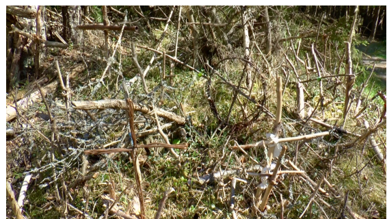
Cross Hill med massor av handgjorda kors. Hur många ser du på bilden?

Jag tog mig upp i ett av tornen, fick vara lite försiktig på toppen där brädorna börjat ruttna, annars var järnkonstruktionen fortfarande stabil. Väl uppe var det en fantastisk utsikt över långa sandstränder. Nästa anhalt var Cross Hill. ”Hill” var väl att ta i. Dagö är väldigt platt och det var svårt att se någon höjdskillnad utom möjligen en liten vall. Det var härifrån som cirka tusen svenskar år 1781 tvingades att utvandra till fots och fick genomgå många umbäranden innan knappt hälften av dom efter månader nådde sitt nya land i Ukraina. Numer reser många hit för att bygga ett kors av trä, sten eller annat material. Det finns tusentals enkla små kors av grenar som flätats ihop av bark, gräs eller rep. Det sägs att den som placerar ett kors här kan ge lycka, t.ex. inför giftermål.