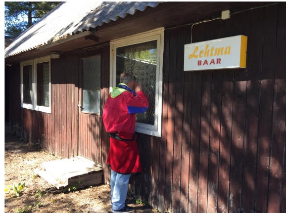
Baren i Lehtma – undrar när den öppnar?

Det var förbjudet att äga båtar större än små roddbåtar. Det var inte lätt att fly. Det påminner om dagens flyktingar på Medelhavet som ger sig ut i små gummibåtar.