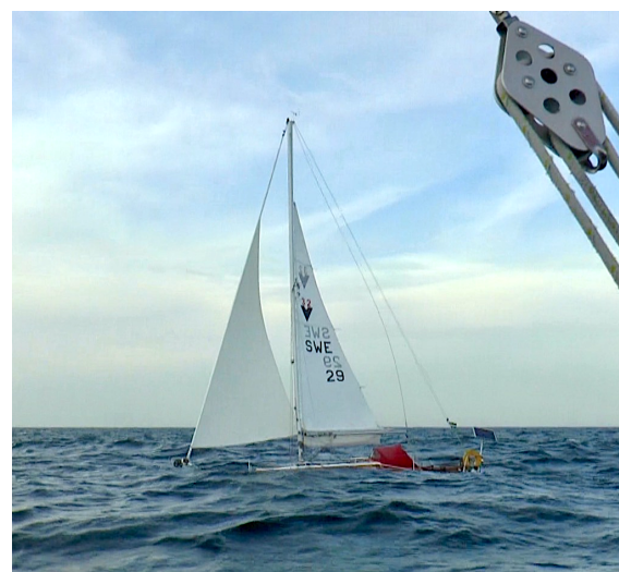
Albertina dyker i vågorna.

Precis som prognoserna sa så vände vinden mot norr strax efter att vi slog söderut och gav oss en bra kurs direkt mot Sandhamn. Det blev en vacker soluppgång och vinden låg stadigt på 12-15 m/s under förmiddagen, 18 m/s som värst. Det skvätte en hel del över sittbrunnen, men humöret var på topp och vi sken ikapp med solen. Tyvärr upptäckte jag en del läckor när horisontellt vatten tog sig in vid masten och i babords garderob.