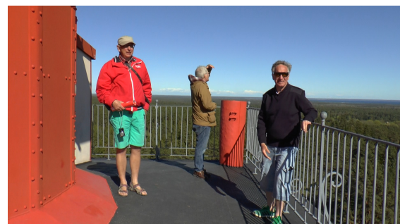
Men det var det värt! Utsikten från toppen var hänförande.