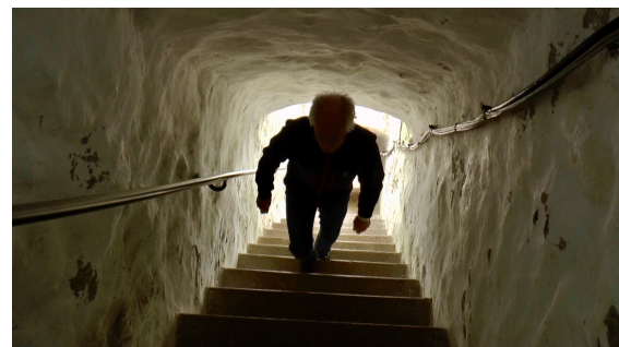
Många steg i trappan upp mot Köpu's fyrtopp blev det!

Direkt efter Tahkuna åkte vi till den ändå mer kända fyren – Köpu. Den står en bra bit in på land för att synas åt både norr, väster och söder. Trappuppgången var lång, trång och smal, men väl däruppe såg man nästan hela Dagö och vyn avslöjade hur platt ön är.