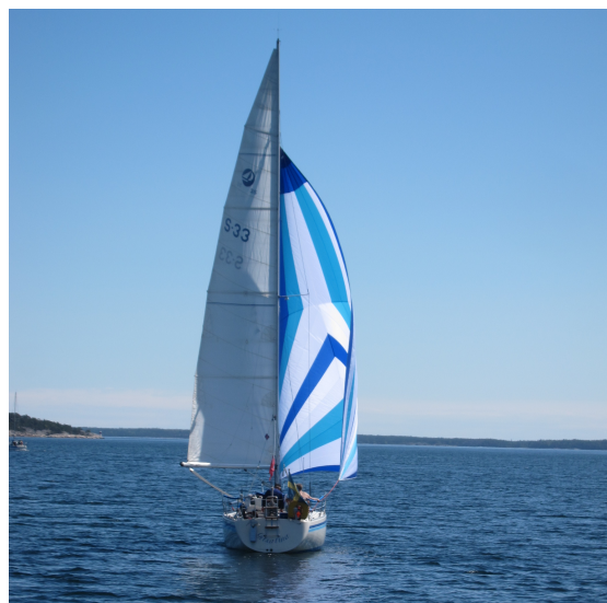
Gitsan med gennaker på väg mot Stockholm.