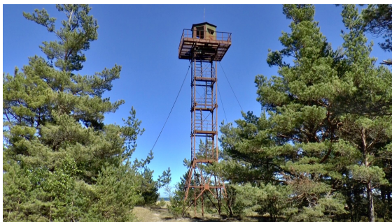
Ryskt övervakningstorn – vacker utsikt från toppen.

Det var förbjudet att äga båtar större än små roddbåtar. Det var inte lätt att fly. Det påminner om dagens flyktingar på Medelhavet som ger sig ut i små gummibåtar.