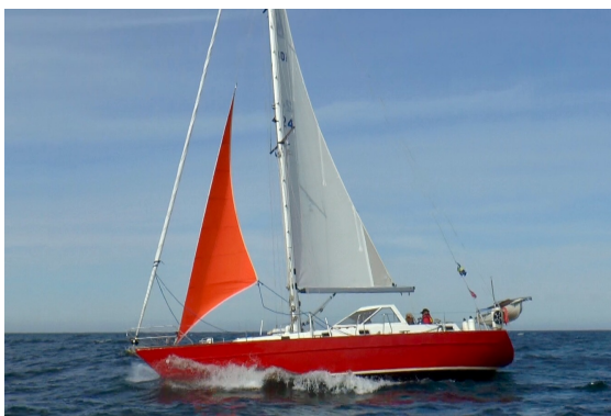
Rubina med vacker stormfock kryssar hemåt.