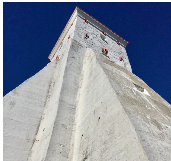
Köpu fyr – Europas näst äldsta fungerande.

Direkt efter Tahkuna åkte vi till den ändå mer kända fyren – Köpu. Den står en bra bit in på land för att synas åt både norr, väster och söder. Trappuppgången var lång, trång och smal, men väl däruppe såg man nästan hela Dagö och vyn avslöjade hur platt ön är.