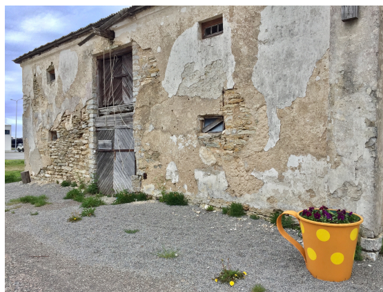
Gammalt hus i hamnen med pynt för att göra det trevligare – ett konstverk.