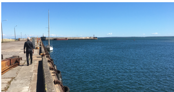
Lehtma hamn där eskadern lade till 1992. Den ser precis likadan ut 2017.