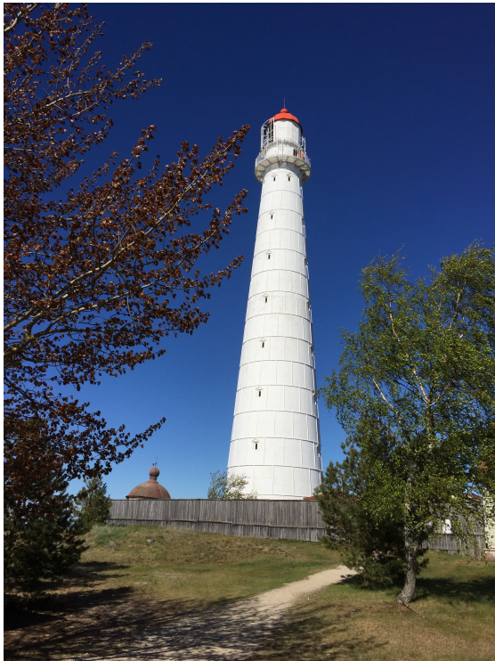
Tahkuna fyr på Dagös nordspets – hjälpte oss in mot Kärdla på natten.

världsutställningen i Paris 1871 och är Estlands högsta torn - 42,7 m över havet. Framför fyren vid strandkanten finns ett monument för dom som dog vid Estonia-katastrofen. Det har en konstruktion som gör att en klocka ringer bara om vinden blåser med samma kraft och i samma riktning som den ödesdigra natten i september 1994.