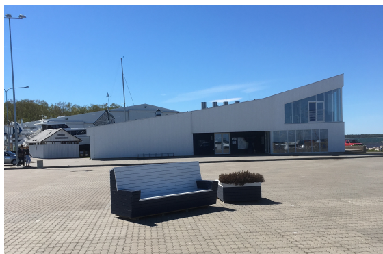
Gästhamnsbyggnaden - ny och fräsch.

Gästhamnen har Y-bommar med plats för två båtar mellan varje par. Det finns alldeles nya och fräscha duschar, bastu och toaletter och en restaurang med bar bara 100m från kaj. Sven, gästhamnskaptenen, var väldigt trevlig och hjälpsam. På bryggorna finns el och vatten, medan toatankstömning och diesel finns vid kajen.