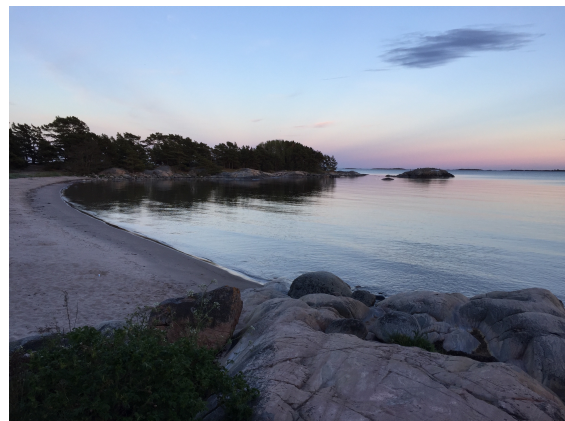
Trouville sen kväll före avfärd mot Estland.

Före avfärden kl. 23 på onsdagsnatten hann vi med en promenad till Trouville.