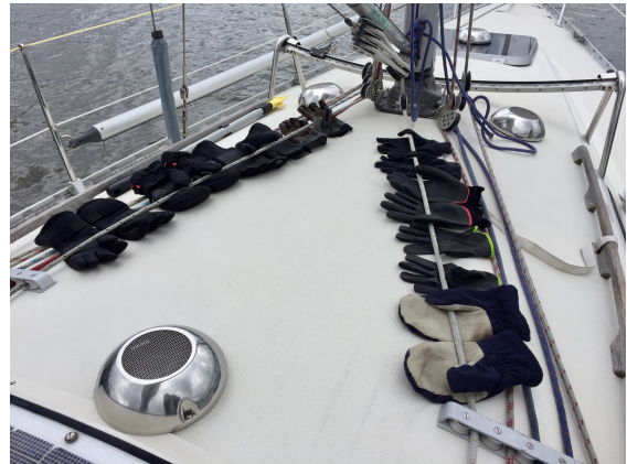
Många blöta handskar blev det under hemfärden. Först vågor, sedan regn.

Det blev ytterligare en tidig morgon, avfärd kl. 06, och mulet väder med smala fjärdarna mot Södra Björkfjärden. Gitsan seglade mesta delen medan Rubina och Albertina mest gick för motor. Det var delvis svaga västliga vindar så farten var inte hög. Väl ute på öppet vatten kunde vi segla oss upp emot Stallarholmen. Nu började molntäcket spricka upp och solen tittade fram. Vindarna var nordvästliga så det blev en hel del motorgång. Som vanligt ankrade vi upp kring Rubina vid Vaxängsskäret mellan Stallarholmen och Strängnäs för en gemensam lunch.