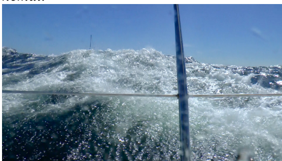
Vågorna växte sig stora i vindar som stadigt låg på 12-15 m/s och som max 18 m/s. Ser du Rubinas mast på bilden?