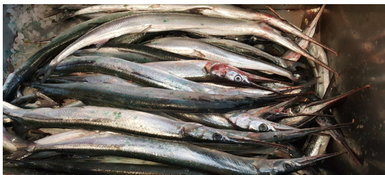
Näbbgäddor i massor.