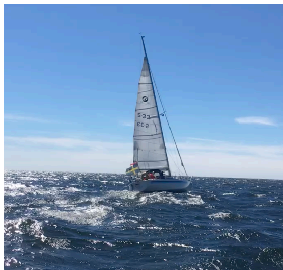
Gitsan med enbart stor i kuling på hemväg.

Vi testade vilken operatör som nådde längst ut på havet, men det blev oavgjort mellan Telenor och Telia. Vi kunde meddela att vi klarat av överfarten hem utan problem och med god fart. Vi höll ca 6 knop i snitt på öppna havet. Det tog endast 24 timmar att nå Sandhamn. Väl där tog vi oss en skön dusch, åt middag i våra båtar och sov en välbehövlig god natts sömn.