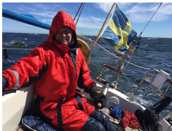
Per nerskvätt av vågor.