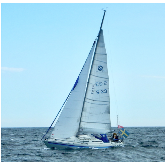
Gitsan med revad stor och fock på kryss före kulingen.