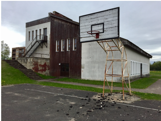
Dåligt underhållen skola med gård.