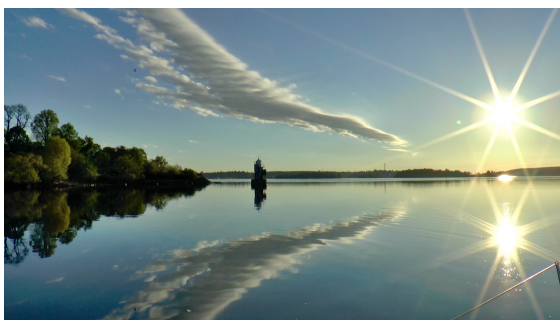
Vackert, men motorgång, efter Hjulstabron.