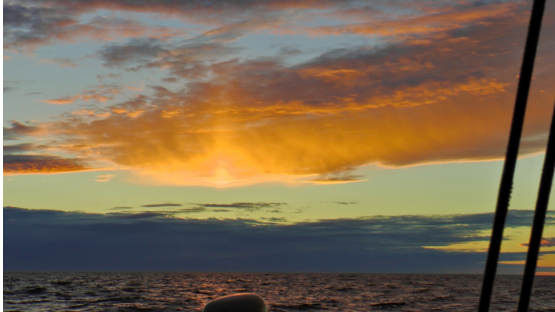
Dramatisk himmel över havet med solnedgång över Sverige.

Dagö. För att underlätta navigeringen hade vi lagt in en fiktiv anöringspunkt utanför Dagö och en rutt dit som låg som ett rakt streck på GPS:en.